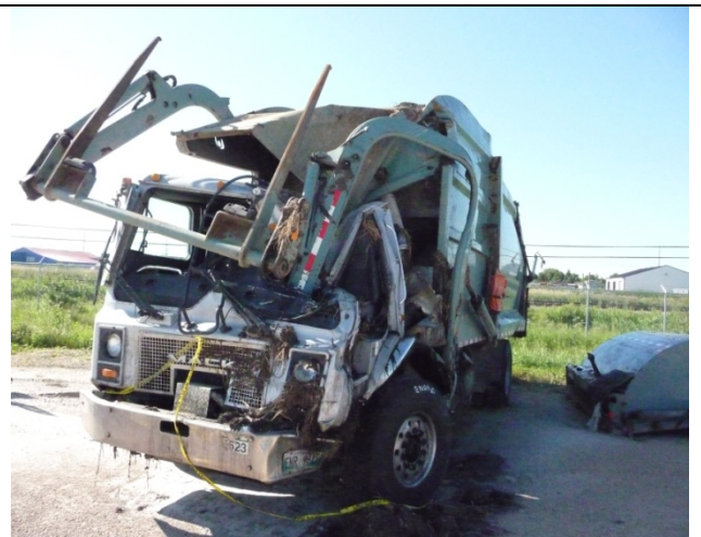
Photo 2. Camion de déchets Mack