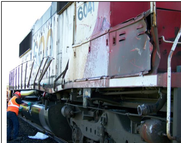
Photo 1. Locomotive SOO 6041

Le jour de l'accident, le conducteur a commencé sa journée de travail à l'heure habituelle. Après avoir fait sa première collecte et rempli son camion, il s'est dirigé vers l'est sur le chemin Leclair en direction du site d'enfouissement. La radio de bord était réglée à faible volume et les glaces étaient relevées. Le camion roulait à une vitesse d'au moins 60 km/h à l'approche du passage à niveau. En raison de l'étroitesse du chemin de gravier à 2 voies, le conducteur devait manœuvrer pour éviter une automobile venant en sens contraire. Les 2 véhicules se sont croisés à une distance d'environ 75 mètres à l'ouest du passage à niveau; le conducteur du camion, qui ne portait pas de lunettes de soleil, avait le soleil sur l'horizon dans son champ de vision. À quelque 10 à 15 mètres du passage, il a aperçu le train et a serré les freins, puis a donné un coup de roue vers la droite (sud) avant de percuter la deuxième locomotive. Le camion a été poussé dans le fossé, où il s'est renversé et s'est immobilisé au sud-ouest du passage à niveau.