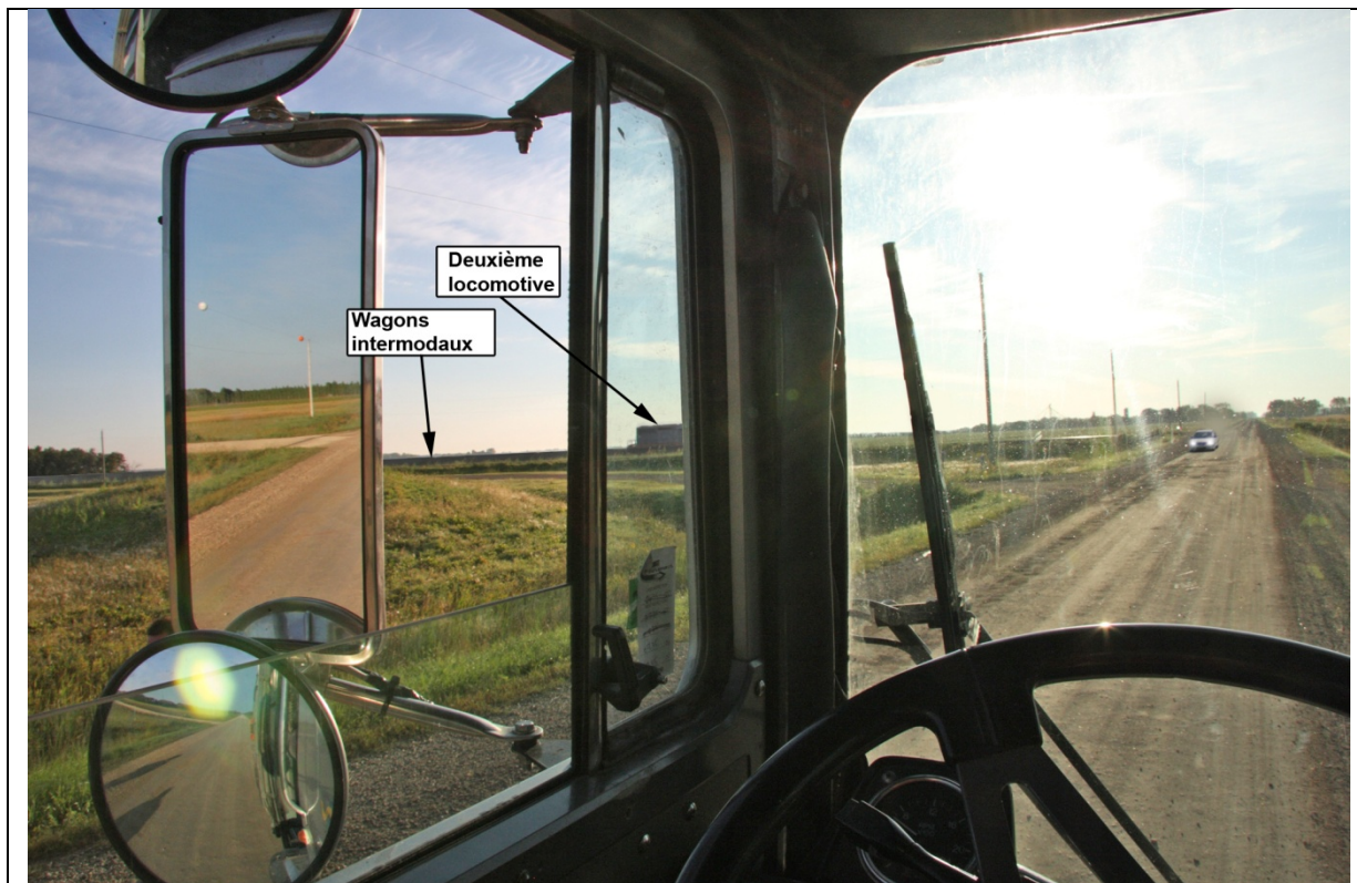
Photo 3. Vue simulée de l'approche du passage à niveau. La position précise des véhicules et les conditions environnementales peuvent ne pas être identiques à celles existant au moment de l'accident.