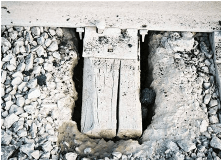
Figure 2. Ballast contaminé et pompage des traverses

Sur toute la longueur de la zone de déraillement, y compris les passages à niveau, le ballast était contaminé et saturé d'eau et on pouvait voir des signes de pompage de la voie (voir la figure 2). Dans les environs, on trouvait essentiellement des terres agricoles planes, dont certaines servaient de pâturage et d'autres, de terres cultivées. Les terres agricoles comportaient des fossés d'assèchement qui croisaient le chemin de fer et les fossés de route. Il y avait trois ponceaux et un pont entre le point milliaire 44 et le passage à niveau du 16 e chemin de canton. Les ponceaux n'étaient pas obstrués. Les fossés des deux côtés de la voie avaient une profondeur d'environ six pieds à partir du patin de rail et ils contenaient de l'eau.