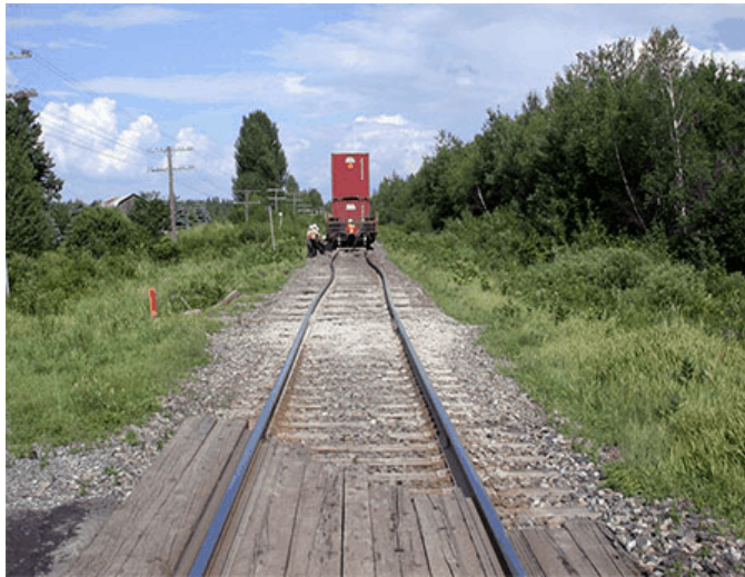
Figure 3. Flambage de la voie, vue vers l'est

La voie présentait des signes de pompage important à partir du passage à niveau jusqu'au bogie arrière du dernier wagon déraillé au point milliaire 46. Le ballast était saturé de poussière de roche et de boue. Le vide à l'extrémité des vieilles traverses, là où les traverses s'étaient déplacées, était rempli d'eau et de boue.