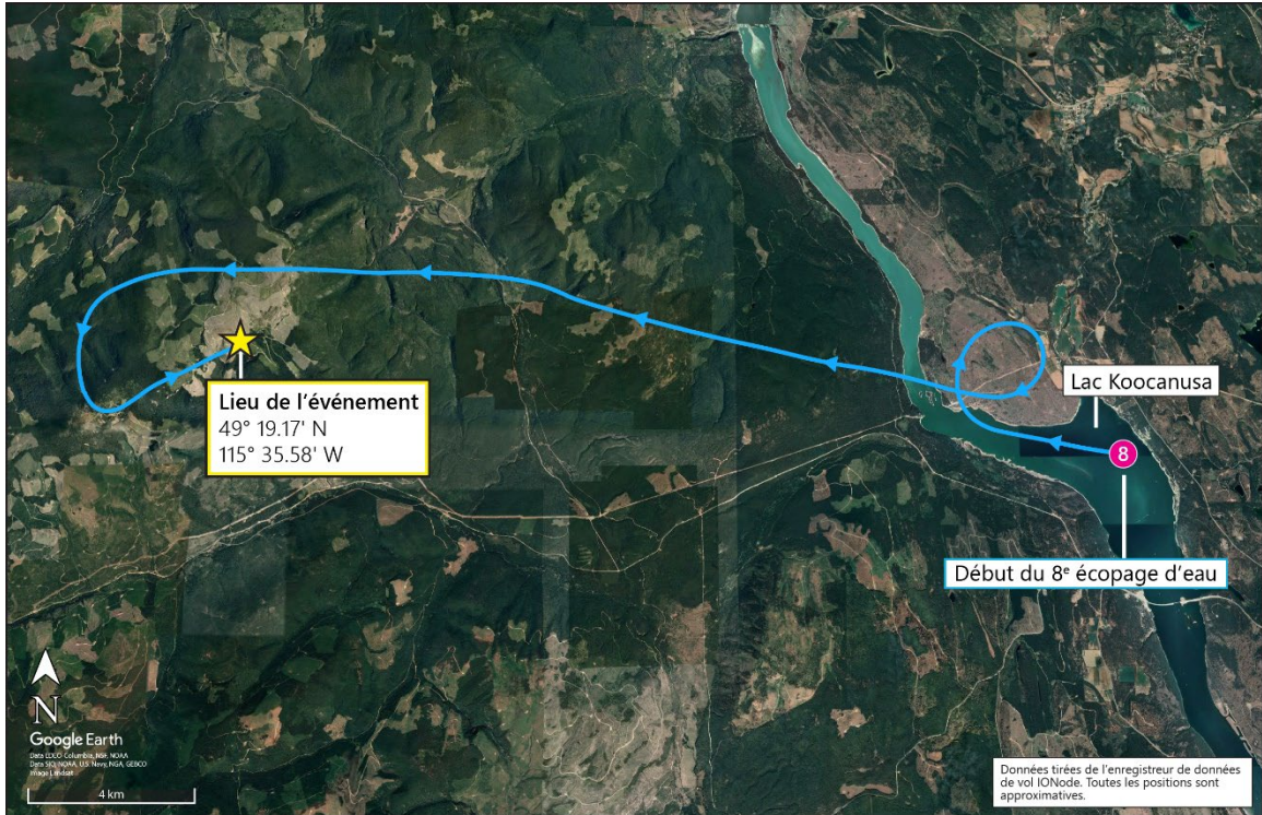
Figure 1. Carte montrant la trajectoire de vol de l'aéronef au 8 e passage d'écopage et le lieu de l'événement

Alors que l'aéronef descendait vers le sol à travers les arbres, un petit arbre a été coupé et a traversé le pare-brise, frôlant le casque du pilote. Le pilote a été recouvert d'éclats de verre provenant du pare-brise fracassé. L'aéronef s'est immobilisé à environ 200 m de la bordure de l'incendie de forêt.