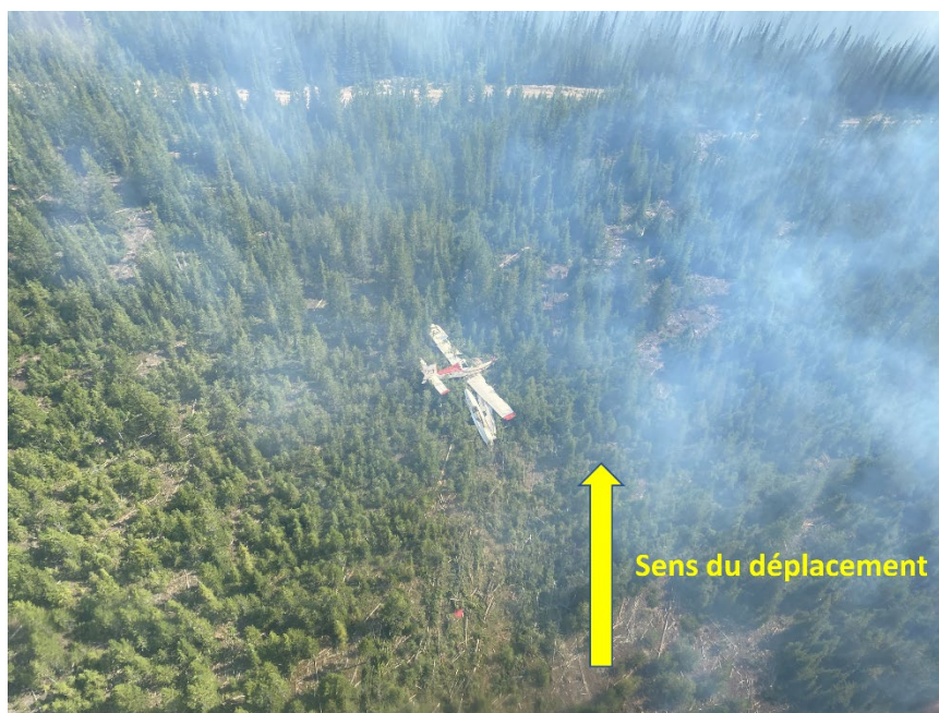
Figure 2. Lieu de l'accident

L'aéronef s'est immobilisé à environ 200 m de l'incendie incontrôlé de Connell Ridge. À cet endroit-là, l'aéronef tout entier risquait de prendre feu. Cependant, la direction changeante des vents et des opérations de lutte contre l'incendie continues dans le secteur ont permis de récupérer l'aéronef quelques jours plus tard.