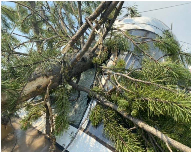
Figure 4. Arbre traversant le pare-brise avant et pénétrant dans le poste de pilotage de l'aéronef à l'étude après la collision