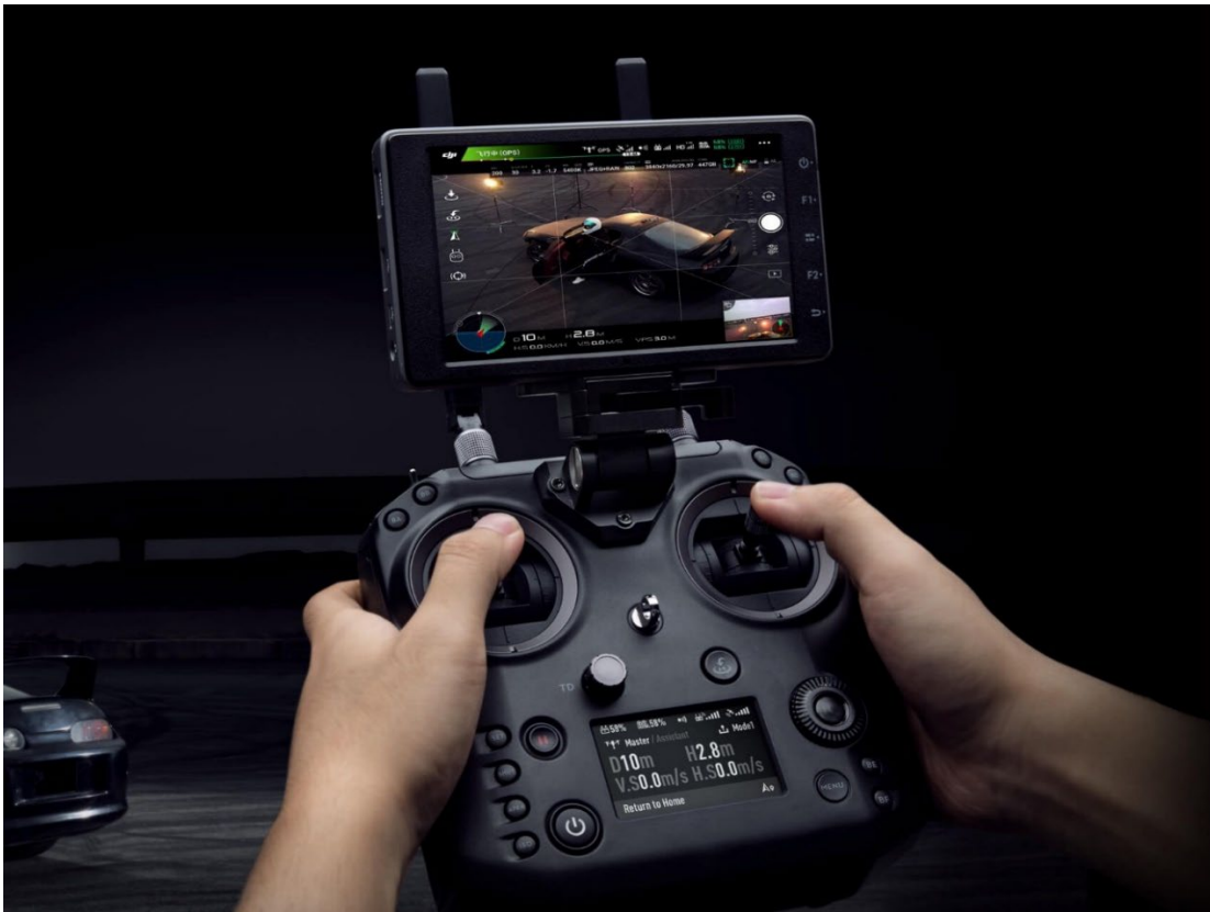
Figure 5. Photo du contrôleur DJI Cendence, sur lequel est monté l'écran CrystalSky

L'ATP à l'étude était enregistré auprès de Transports Canada (TC) comme l'exige la réglementation.