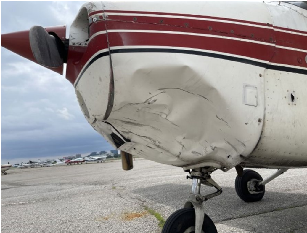
Figure 2. Photo des dommages subis par l'avion à l'étude

Le Cessna présentait des dommages sur le capot inférieur gauche du moteur et la boîte à vent du carburateur, ainsi que des rayures mineures sur l'hélice (figure 2).