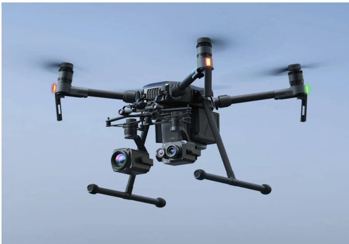
Figure 4. Photo d'un aéronef télépiloté DJI Matrice M210

Dans l'événement à l'étude, le pilote pilotait l'ATP à l'aide d'un contrôleur intelligent DJI Cendence équipé d'un écran DJI CrystalSky (figure 5). La transmission vidéo était configurée pour s'afficher également sur un écran de télévision plat monté sur le véhicule de déploiement de l'ATP. L'écran de télévision affiche les images aériennes en temps réel, mais pas les renseignements télémétriques qui sont affichés sur l'écran CrystalSky monté