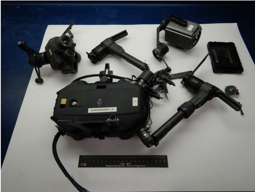
Figure 3. Photo des pièces de l'aéronef télépiloté qui ont été récupérées