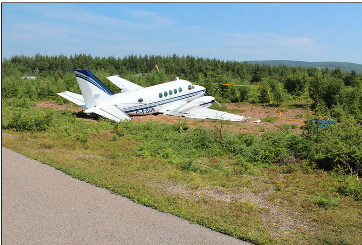
Figure 1. Aéronef à l'étude