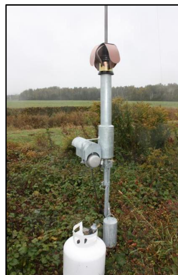
Photo 1. Canon à propane

Ce type de canon conjugue un stimulus visuel et auditif pour effaroucher les oiseaux. Le canon au propane produit une impulsion pour propulser un mécanisme poussoir qui fait coulisser un disque de caoutchouc frangé le long d'un poteau monté sur un trépied. Le poussoir retombe rapidement, tandis que le disque descend plus lentement à la manière d'un parachute. Ce « leurre » imite un faucon donnant la chasse à un oiseau. Le canon serait efficace dans un rayon de 150 mètres.