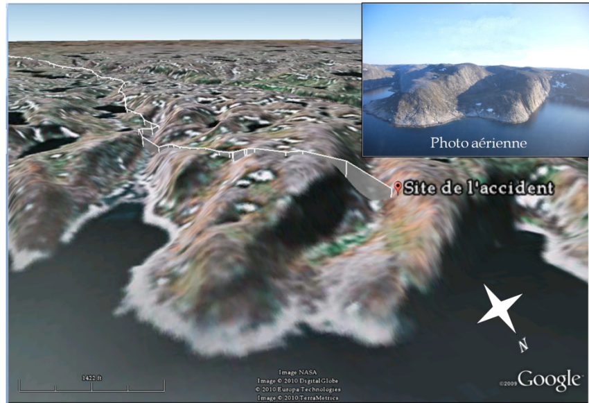
Figure 1. Trajectoire enregistrée par le système de positionnement mondial (GPS)

L'accident s'est produit à un peu moins de 1 nm du détroit d'Hudson, dans une vallée côtière située à 36 nm au sud-est de Kangiqsujuaq. La vallée orientée vers l'ouest est enclavée par deux escarpements rocheux et mesure environ 2300 pieds de largeur. Le sommet du flanc sud est à 1050 pieds asl; celui du flanc nord est à quelque 820 pieds asl. L'appareil se dirigeait en direction nord lorsqu'il a heurté le flanc nord de la vallée à environ 700 pieds asl.