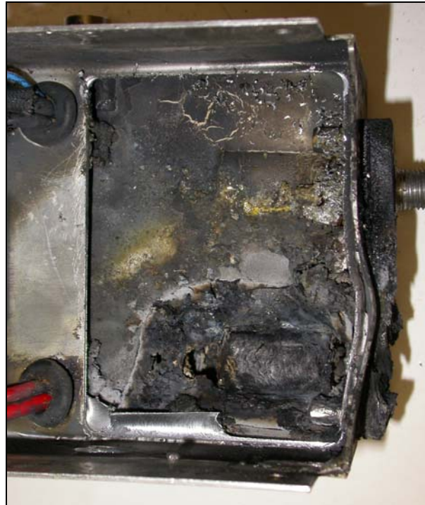
Photo 2. Aperçu du filtre une fois la plaque inférieure enlevée.

La surchauffe du filtre de la motopompe à courant continu de l'avion en question est la première défaillance en vol du genre qui est signalée. Toutefois, au moins deux autres défaillances semblables du filtre se sont produites au cours de la dernière année. Ces deux défaillances se sont produites alors que les avions étaient au sol. En novembre 2006, la motopompe à courant continu de l'aéronef portant le numéro de série 20022 est tombée en panne au cours d'un point fixe. En avril 2007, la motopompe à courant continu de l'aéronef portant le numéro de série 20023 est tombée en panne alors que l'aéronef circulait au sol. Les codes de date de fabrication des deux filtres en question indiquaient que ceux-ci provenaient du même lot. Les dommages causés par la chaleur ont détruit la date estampée sur le filtre dans l'incident en question.