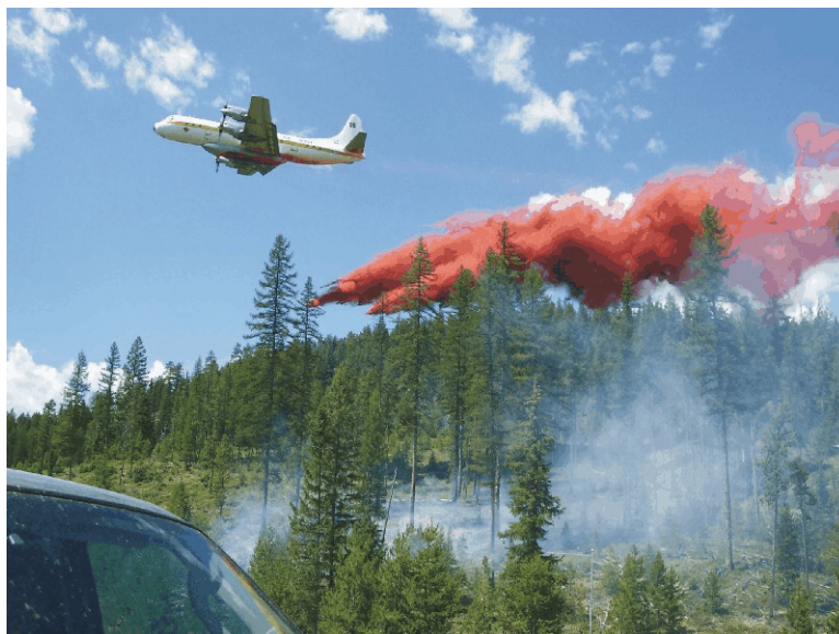
Photo 1. Tanker 86 larguant le produit ignifuge sur le feu à éteindre, à 12 h 20 HNR

L'avion pointeur a ensuite suivi le profil de vol proposé pour le largage du produit ignifuge, effectuant le premier de deux circuits, pendant que l'Electra tournait en rond au-dessus de lui à 5000 pieds asl et observait la démonstration. Aux fins d'efficacité des opérations, après être sorti à droite et avoir traversé les lignes électriques, l'avion pointeur a viré à gauche pour revenir et commencer son deuxième circuit. Les pilotes de l'Electra ont accepté ce premier circuit en ajoutant qu'ils vireraient à droite et suivraient la vallée (vers le lac Moyie), comme le mentionnaient les commentaires des agents de lutte aérienne.