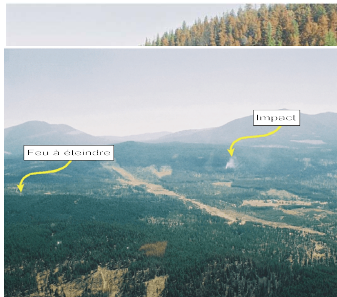
Photo 3. Vue de la vallée vers le sud-ouest

La région environnante est plus densément peuplée d'arbres, lesquels ont tendance à dissimuler le bourrelet périphérique et l'affleurement rocheux que l'appareil a heurté.