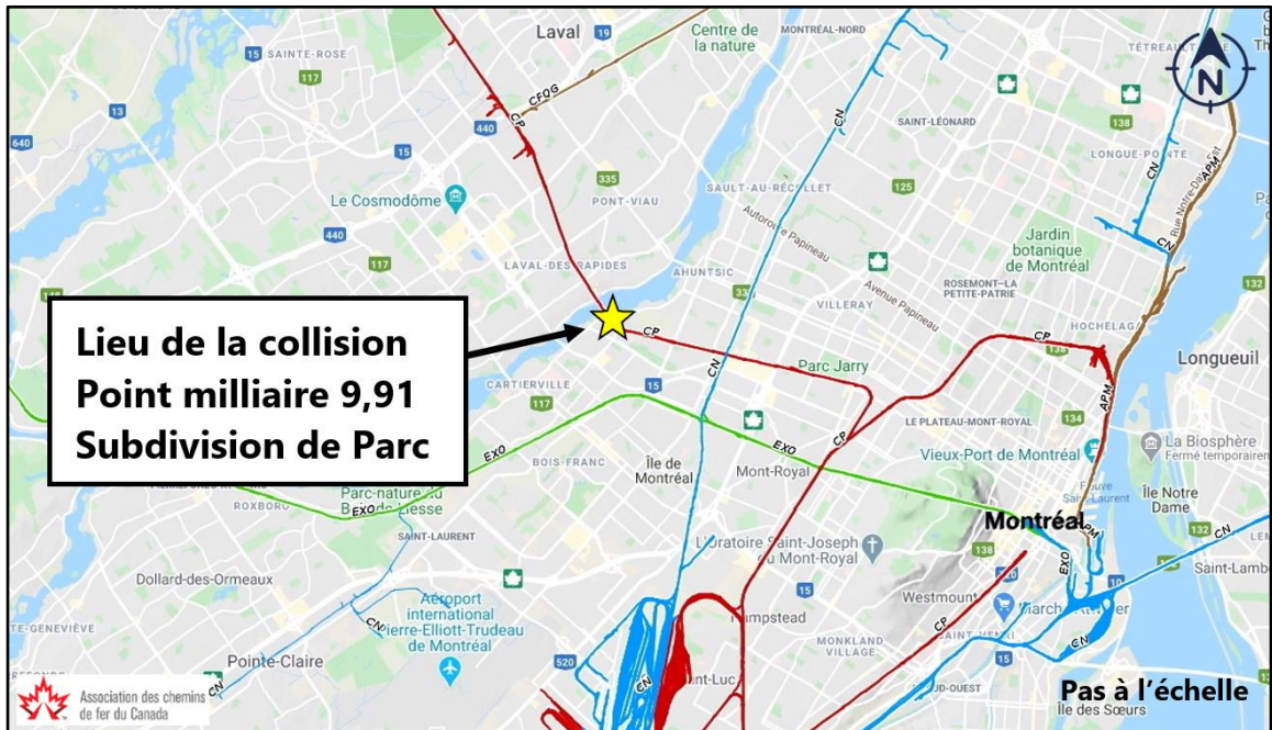
Figure 1. Secteur de la collision

En apercevant une automobile immobilisée sur le PN, le ML a activé le sifflet de la locomotive à 9 h 23 min 19 s puis, environ 3 secondes plus tard, a serré les freins d'urgence. Le train a commencé à ralentir et, 4 secondes plus tard, a heurté l'automobile à la vitesse de 42 mi/h, avant de s'immobiliser environ 200 m plus loin. Les phares avant de la locomotive de tête étaient réglés à leur pleine intensité, les phares de fossé étaient allumés et la cloche de la locomotive était activée 3 .