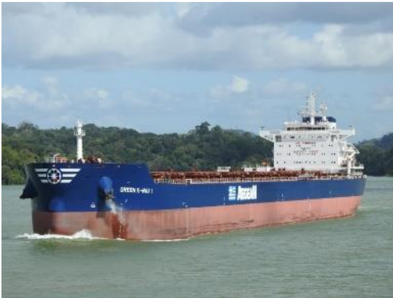
Figure 2. Green K-Max 1

Le Green K-Max 1 est un vraquier d'une longueur de 229 m et d'une jauge brute de 44 076. Il a été construit en 2019 et il est immatriculé sous pavillon du Libéria (n° 9838058 de l'OMI) (figure 2). Au moment de l'événement, 19 membres d'équipage se trouvaient à bord du navire.