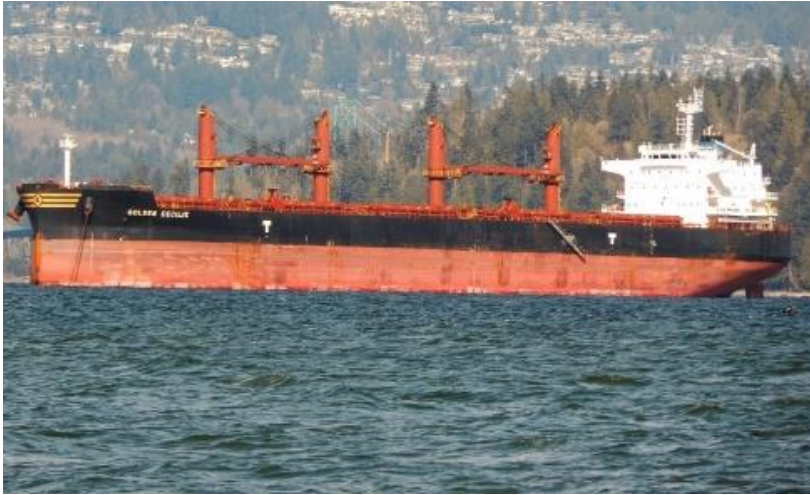
Figure 1. Le Golden Cecilie

Le Green K-Max 1 est un vraquier d'une longueur de 229 m et d'une jauge brute de 44 076. Il a été construit en 2019 et il est immatriculé sous pavillon du Libéria (n° 9838058 de l'OMI) (figure 2). Au moment de l'événement, 19 membres d'équipage se trouvaient à bord du navire.