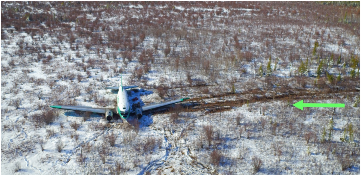
Figure 2. Photo aérienne du lieu de l'accident (vue vers le nord-ouest). La flèche verte indique la trajectoire de l'avion après son poser.

À 8 h 01, l'avion a atterri dans une fondrière sur les terres de la Première Nation K'at'l'Odeeché, à environ 3,5 milles marins au sud-est de CYHY. Une fois l'avion immobilisé, le PO a évacué l'avion par la fenêtre de droite du poste de pilotage, pendant que le commandant de bord est resté dans le poste de pilotage pour éteindre le moteur droit et les systèmes de bord avant d'évacuer l'avion par la porte avant. Le PO a joint le centre d'information de vol pour l'aviser de l'état de l'équipage de conduite et de l'emplacement de l'avion. La radiobalise de repérage d'urgence ne s'est pas déclenchée durant l'atterrissage forcé, donc le PO l'a activée manuellement pour aider les ressources de recherche et sauvetage (SAR) à repérer l'épave. L'équipage de conduite n'a pas subi de blessures. L'avion a été lourdement endommagé (figure 2). Il n'y a pas eu d'incendie après l'impact. Les premiers intervenants sont arrivés sur les lieux de l'accident à 11 h 14.